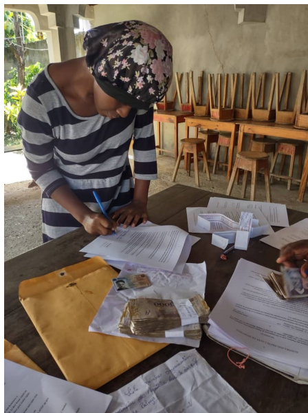
Chacune des personnes bénéficiaires avait à signer un contrat.