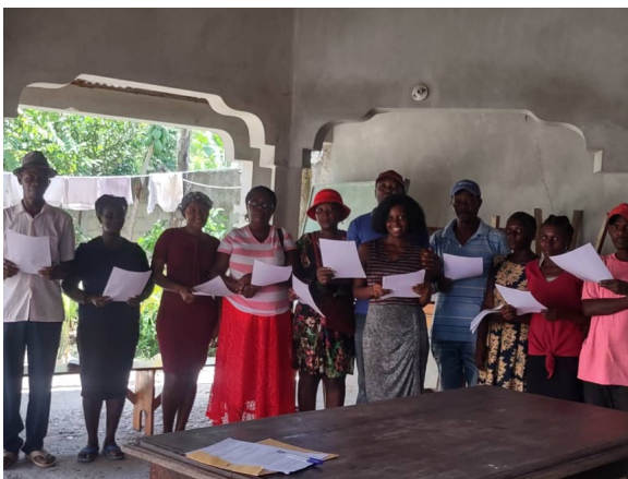
Petites marchandes et agriculteurs ont reçu un prêt.