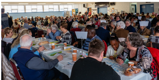
Plus de 200 convives ont participé à l'annuel déjeuner de l'AQANU-Outaouais.

Ce projet, dont on a déjà traité dans le Cyber-bulletin, consiste à introduire et à développer l'enseignement à distance en Haïti, en commençant par certains des cours offerts par l'École de formation professionnelle Mark Gallagher (ÉFPMG), un des établissements d'éducation des Petites sœurs de Sainte-Thérèse (PSST).