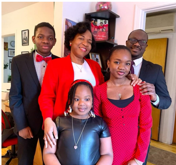
Famille Chery.