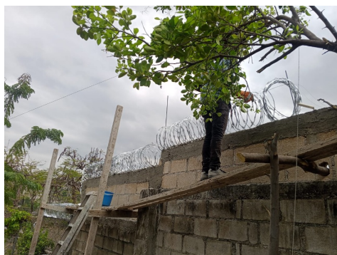
Installation du barbelé

Présentement, nous travaillons à solliciter certaines organisations afin de soutenir la direction. Les fonds éventuellement recueillis serviront à payer les salaires des employés. La communauté des PSST a contribué au financement des deux projets et au paiement des salaires du personnel.