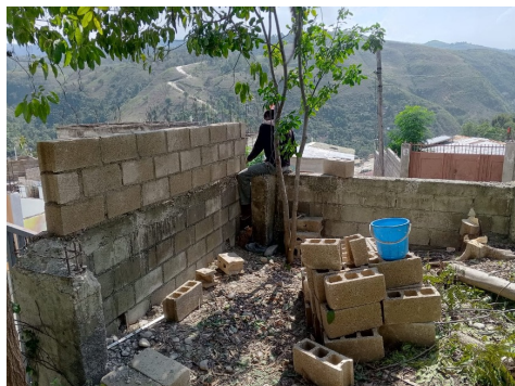
Le mur s'élève.