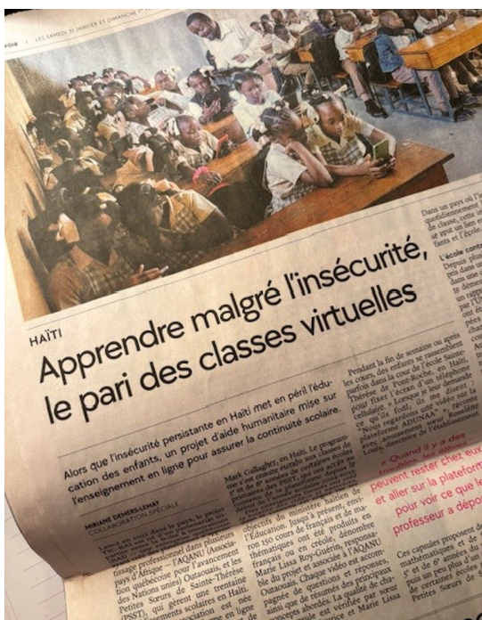
L'article paru dans Le Devoir