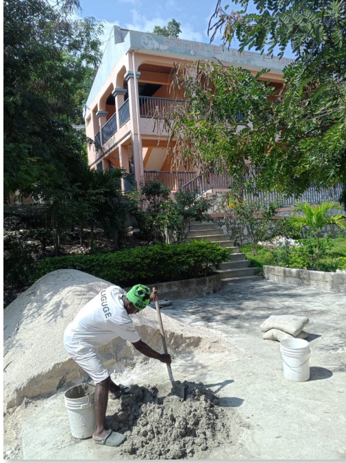
On prépare le béton pour le mur de l'École que l'on aperçoit à l'arrière.