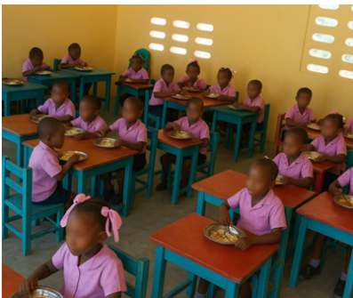
Écoliers de l'École Notre Dame du Lourdes de Ste Suzanne (photo légèrement modifiée pour masquer le visage des enfants)

Face aux difficultés alimentaires qui touchent de nombreuses familles haïtiennes, le projet « Œufs de Table », initié par les Petites Sœurs de Sainte Thérèse de l'Enfant-Jésus (PSST), apporte une réponse concrète en milieu scolaire. Pour l'année académique 2024-2025, près de 3800 écoliers et enseignants ont bénéficié de ce programme dans neuf écoles du